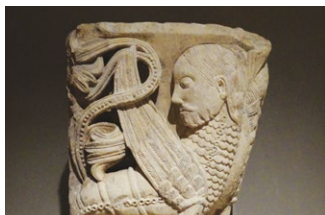
Abbaye Saint-Géry au Mont-des-Boeufs, chapiteau d'angle orné de sirènes, XII e siècle, inv. Sc 223

LES SAMEDI 30 OCTOBRE À 16H ET DIMANCHE 31 OCTOBRE À 10H30 DÈS 6 ANS - DURÉE : 1H30