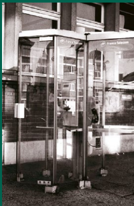
Cabine téléphonique, 2022-2020, tirage baryté