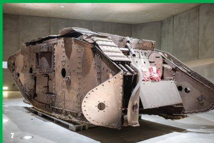
7. Le tank Deborah au Cambrai Tank 1917

RV sur www.cirkwi.com et sur l'application gratuite Cirkwi.