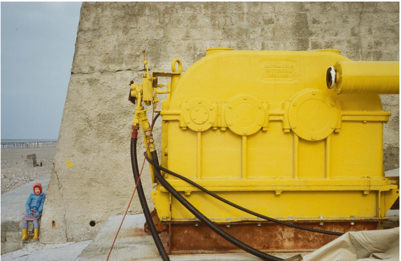
Jean-Pierre Parmentier, série « Littoral », collection CRP/, © tous droits réservés

Ateliers plastiques « Kaléidoscope » , en collaboration avec les équipes du CRP/ et dans le cadre du Février des Sciences du Labo, les mercredis 15 et 22 février 2023 à 14h, durée : 2h, 5/3 €