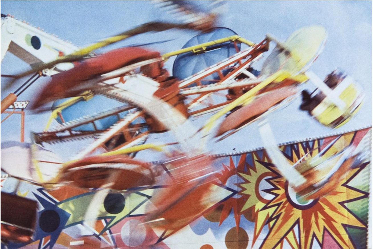
John Batho, Manège , 1979, Artothèque du CRP/, © John Batho