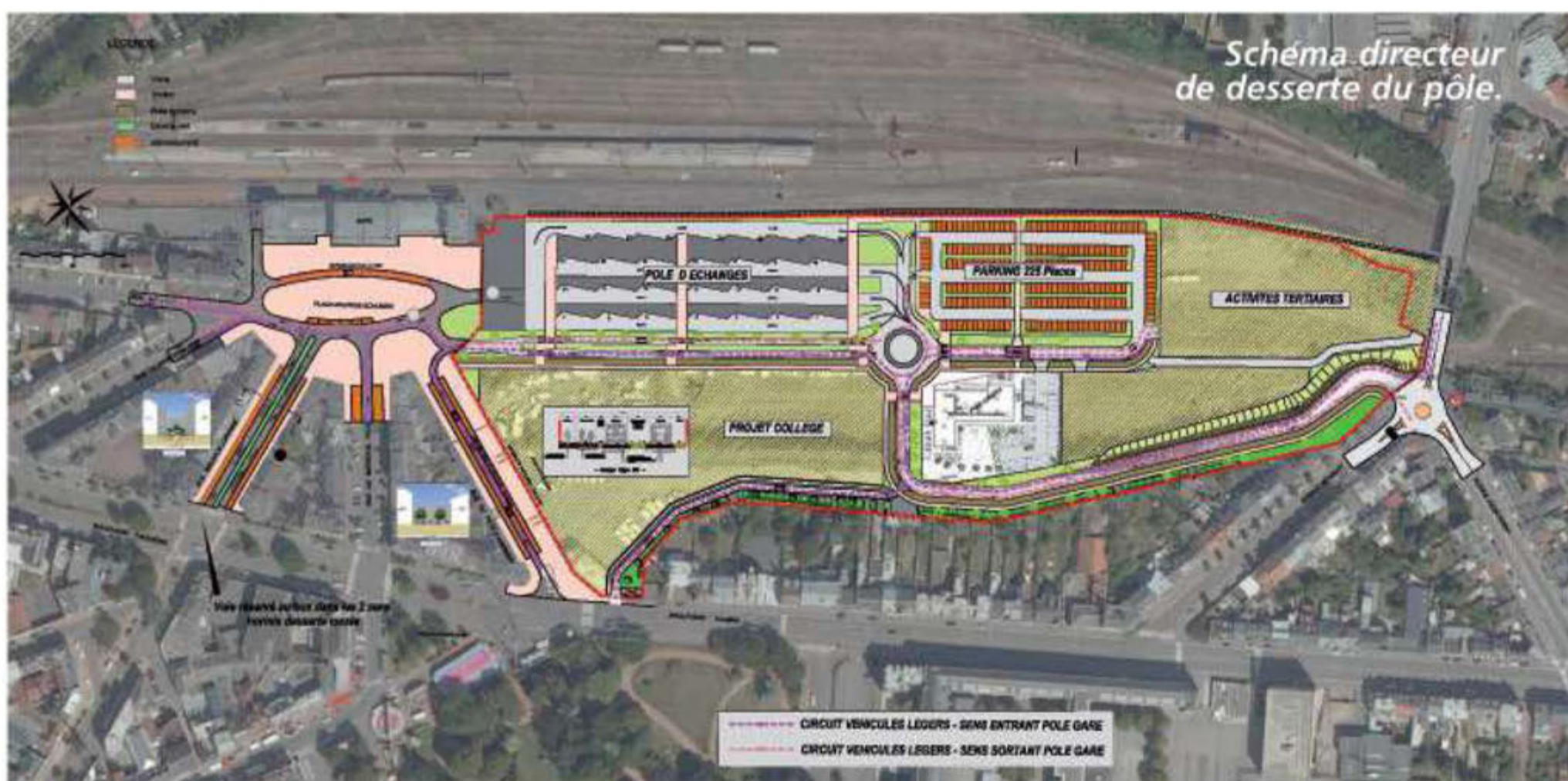
Schéma directeur de desserte du pôle.

truire le futur collège Paul Duez (600 élèves) mais cette décision n'est pas prise officiellement aujourd'hui. Financés par le fonds CRSD, Contrat de Redynamisation du Site de Défense (34 M€), alloué par l'État dans le cadre de la compensation de la fermeture de la base aérienne, les travaux permettront de «relooker» complètement cette zone d'échanges très fréquentée et utilisant tous les moyens de transport comme le train, les bus et voitures, vélos et piétons. Il s'agira en plus d'en faire un espace qualitatif ouvert et adapté aux dernières technologies en matière de communication par exemple. Enfin, un parking de plus de 380 places verra le jour afin d'accueillir les visiteurs dans les meilleures conditions possibles d'accès.