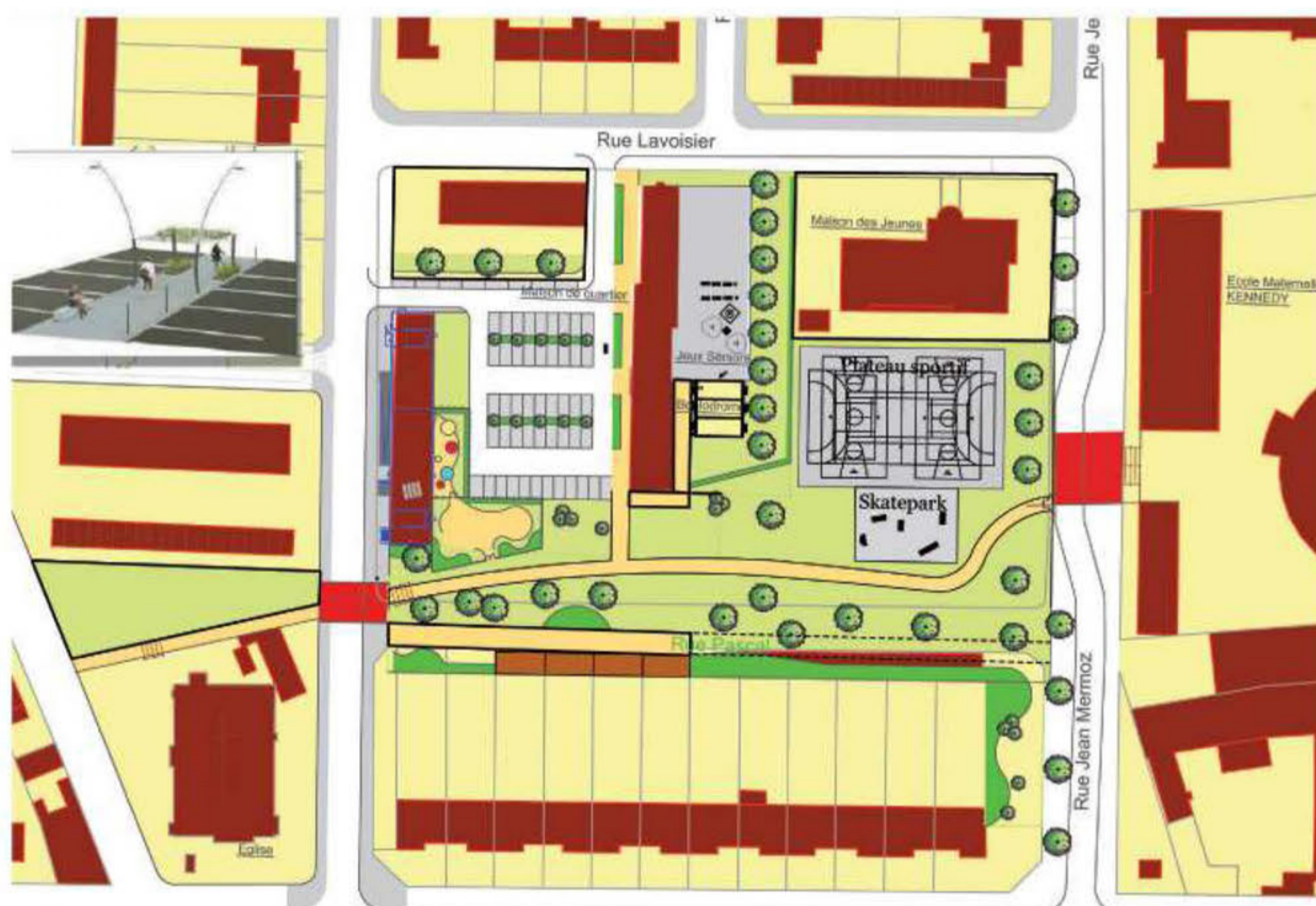
Plan masse de la transformation du centre du Quartier Amérique.

Après un long travail de réflexion, la volonté affichée est donc de transformer la rue Pascal en espace vert pour créer une liaison douce entre l'entrée de l'école Kennedy et la rue Lafayette et même au-delà pour traiter les abords de l'église Saint-Jean. Il s'agit également de garder