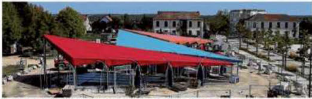
Imaginé par les architectes Patrick Bouchain et Luc-Julienne, le Centre Pompidou mobile s'étend sur 550 mètres carrés.

Le Centre Pompidou mobile présente quatorze chefs-d'œuvre de l'art moderne et contemporain sous une tente à Cambrai, pour trois mois. Une belle expérience inédite.