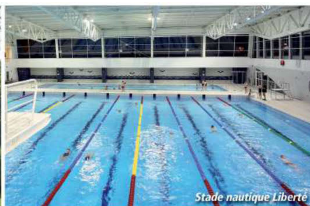
Stade nautique Liberté