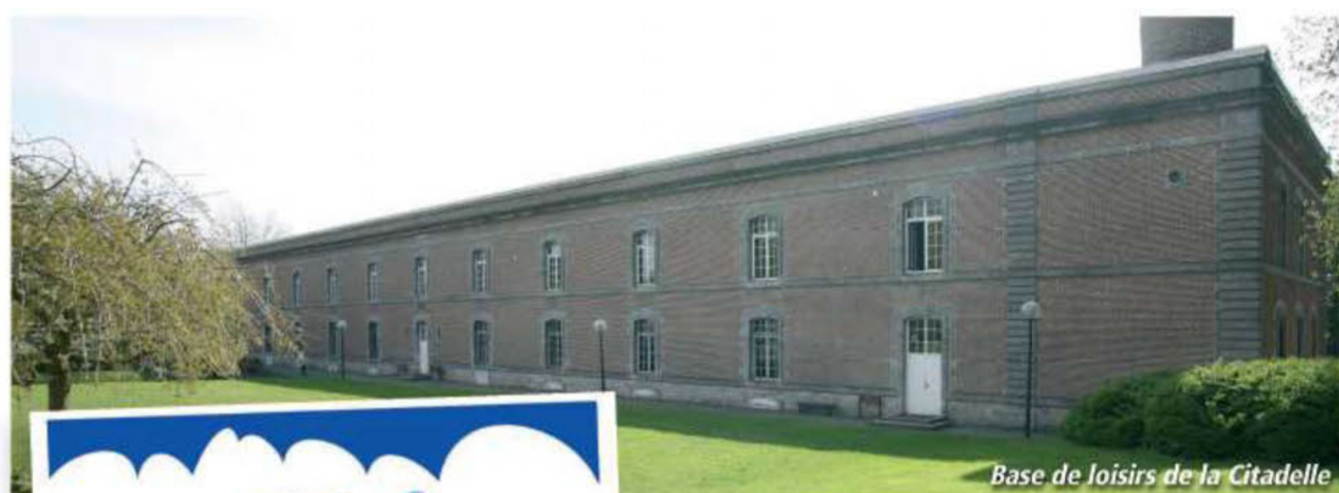
Base de loisirs de la Citadelle

En juillet et en août, ce sera possible grâce aux stages encadrés et animés par les éducateurs sportifs municipaux dans le cadre de la politique d'animation que la ville met en place chaque été.