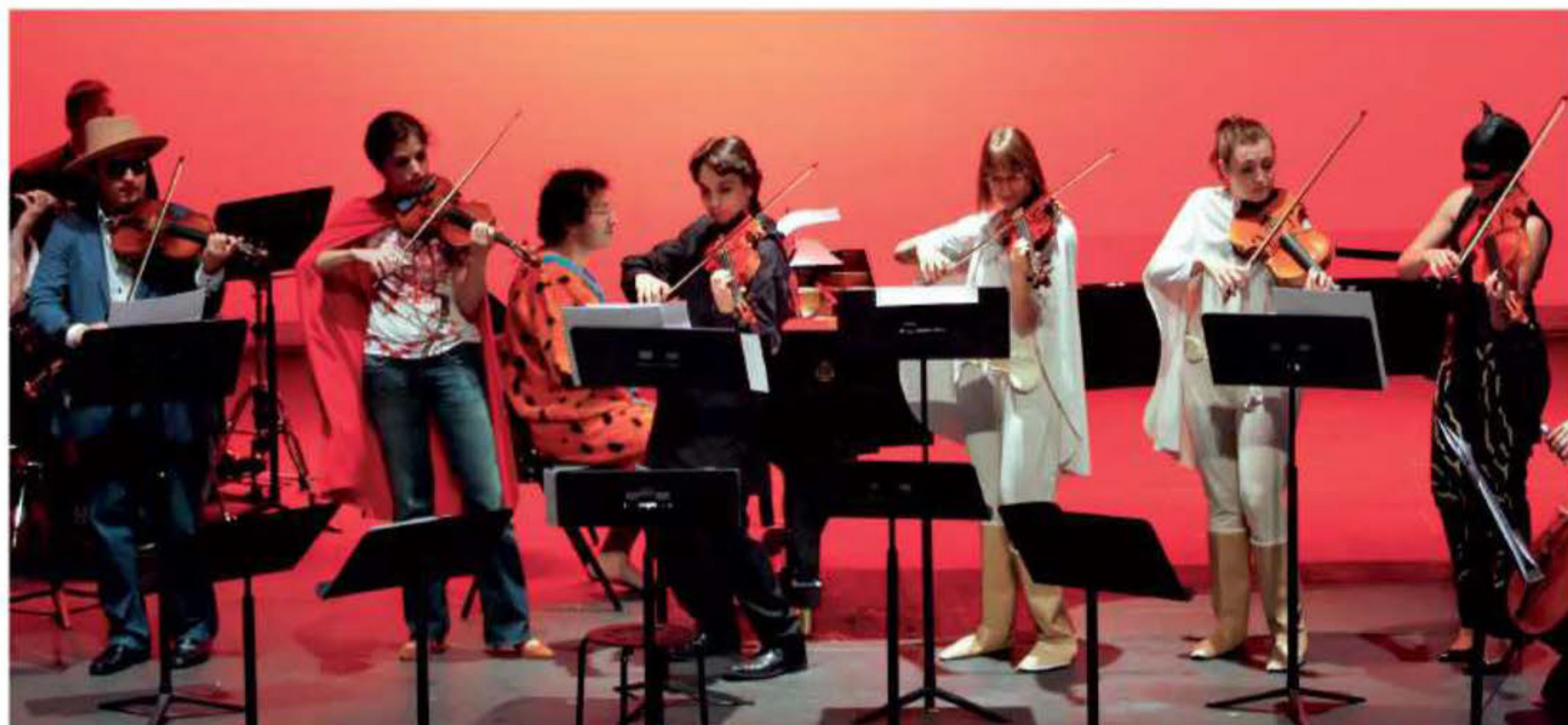
Clôture du Festival Juventus 2011, Théâtre de Cambrai - Photo Pascal Gérard

Lors de cette 22 ème édition, vous pourrez retrouver une trentaine d'anciens lauréats ainsi que trois nouveaux membres de la famille Juventus.