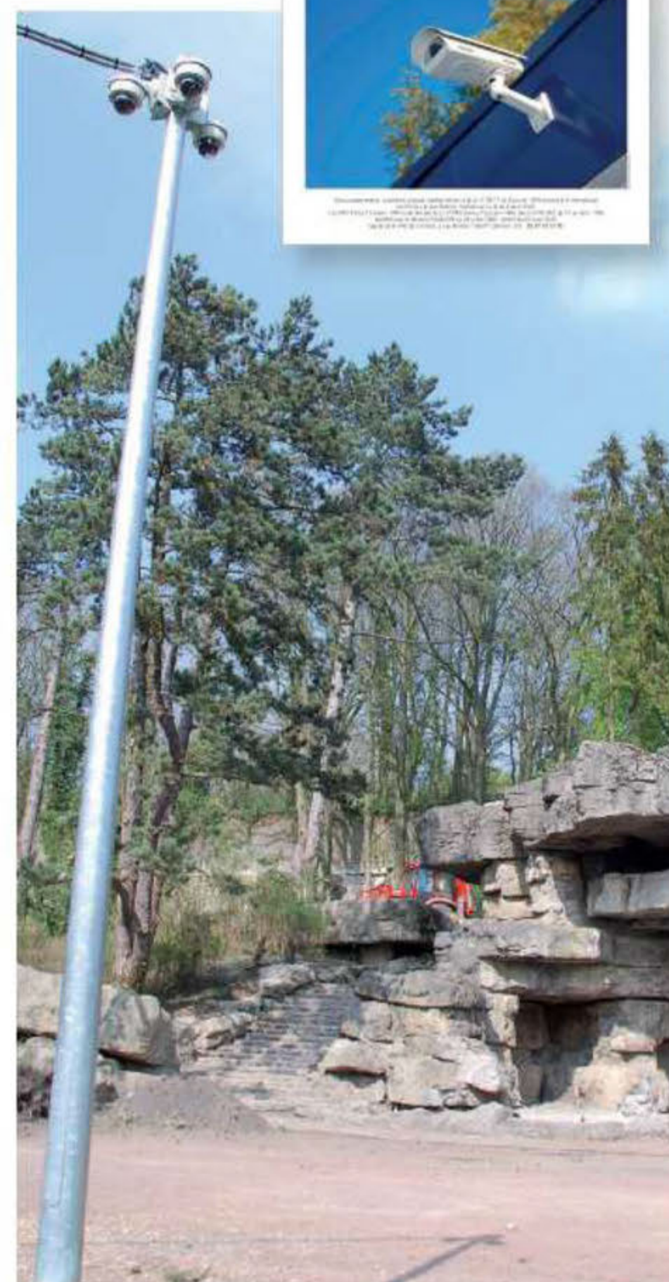
Les caméras proche des Grottes au Jardin Public sont installées sur un mât.

habite aux abords du parc Paul BERT ; Depuis la mise en place des caméras, il y a, dit-elle, beaucoup moins d'actes de vandalisme (carreaux cassés, boîtes aux lettres, etc.). Cette amélioration sensible dans tout le secteur est due à la disparition du phénomène de bandes qui ne viennent