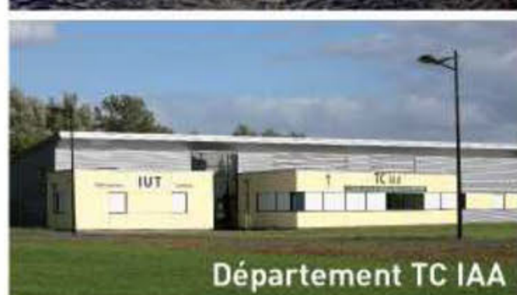
Département TC IAA