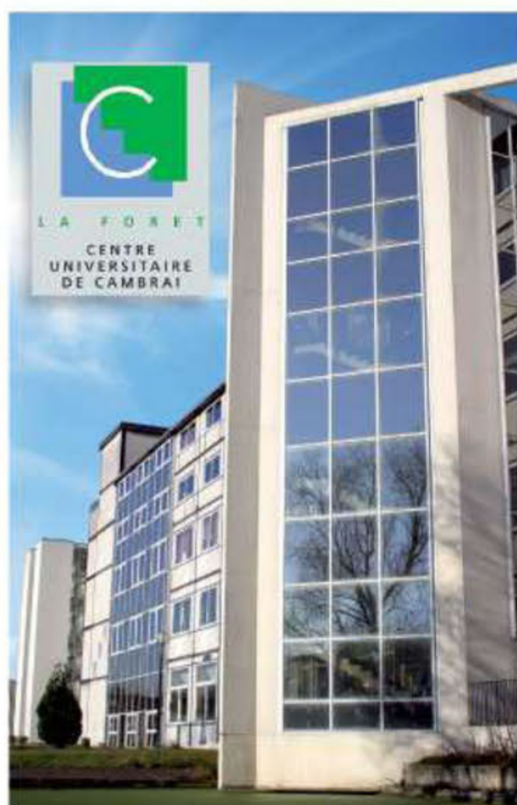
Le bâtiment principal du centre universitaire 6 rue de Rambouillet - CAMBRAI 03 27 72 33 00