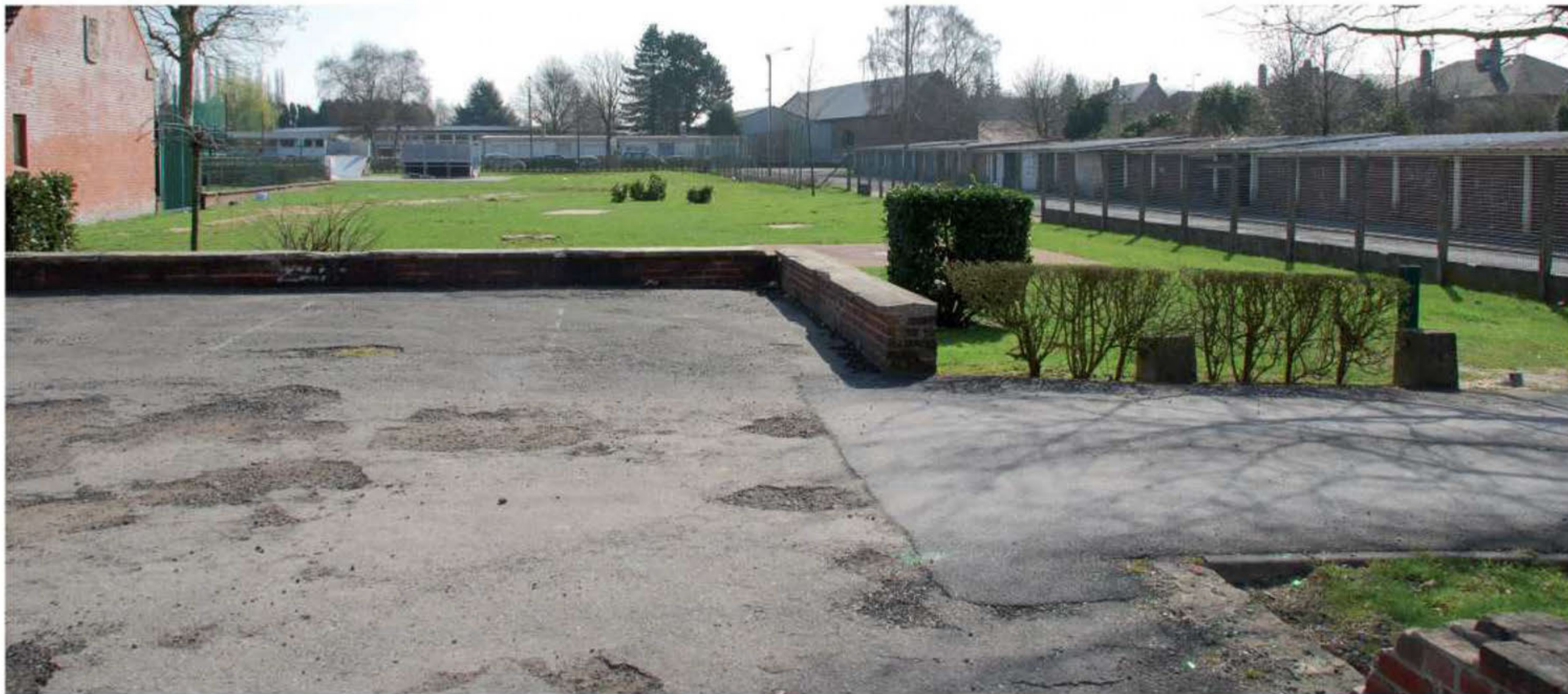
À droite, les garages qui seront bientôt démolis pour faire place à une allée verte.

La municipalité investit pour 2012 dans une profonde transformation du quartier Amérique en remodelant son centre et ses axes de circulation pour relier les différentes zones d'activité.