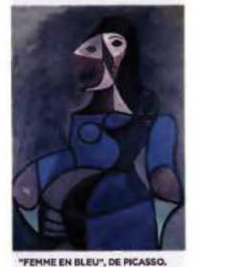
"FEMME EN BLEU", DE PICASSO.