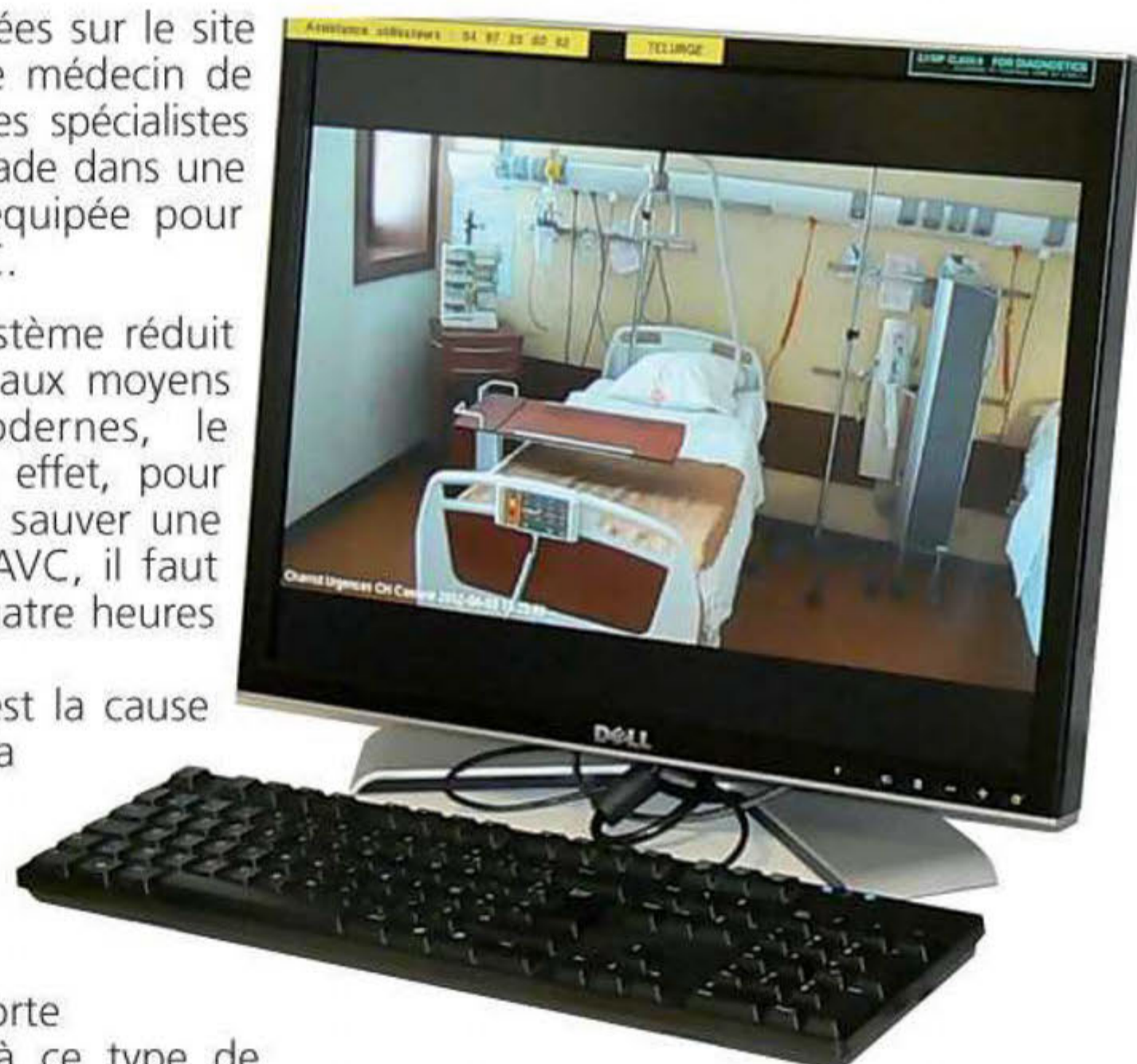
Écran de contrôle de la «Télé-AVC».

L'hôpital de Cambrai apporte désormais une réponse à ce type de problème de santé nécessitant une action rapide et efficace.