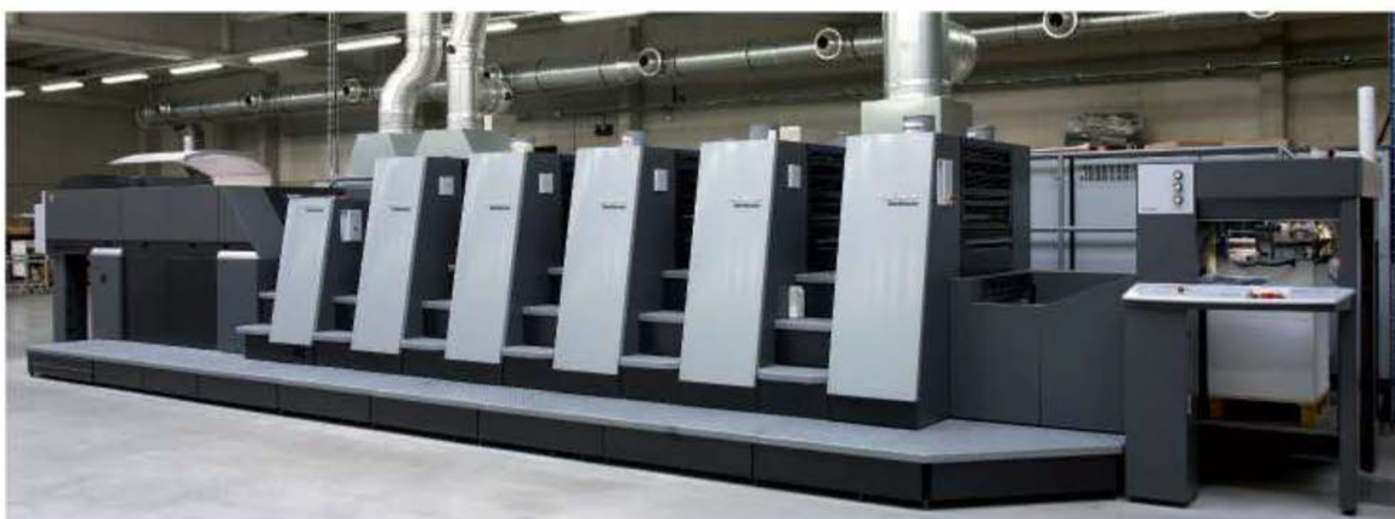
L'investissement sur la nouvelle rotative permettra de développer de nouveaux produits.