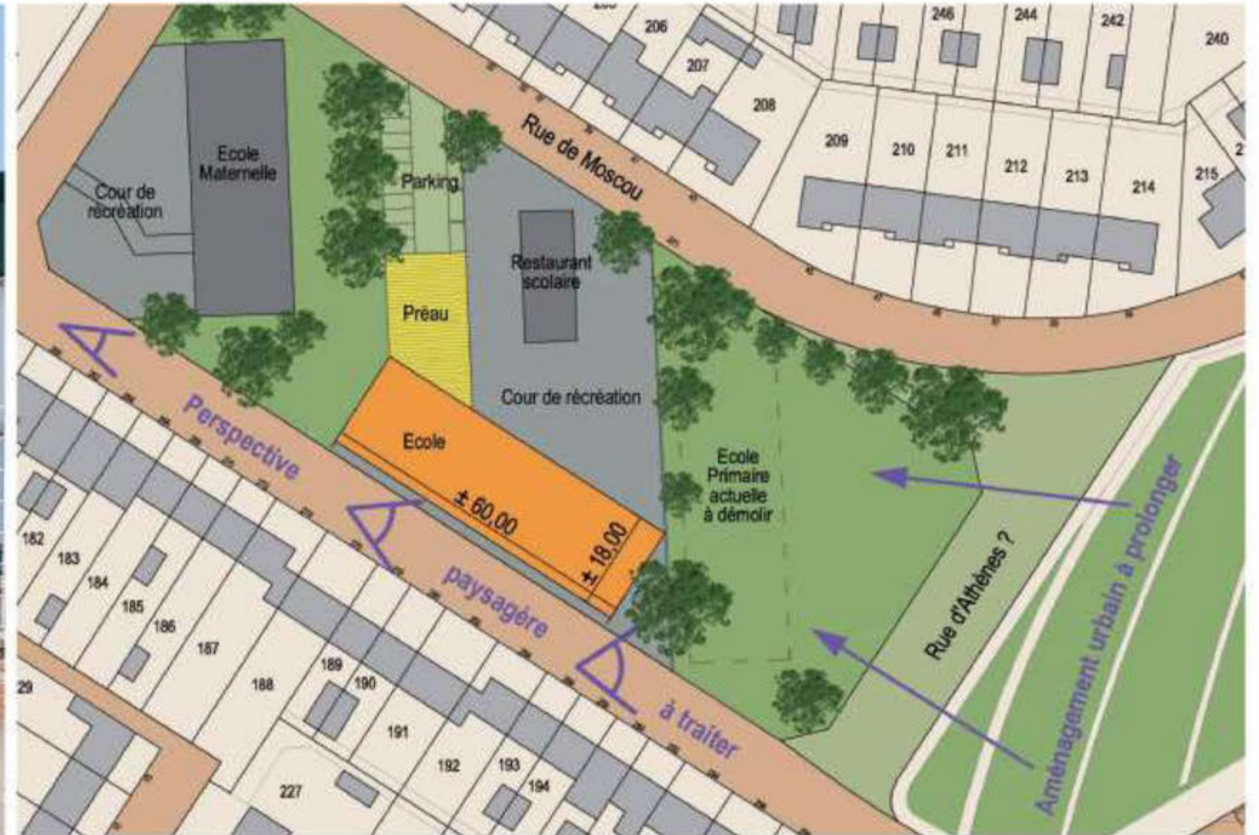
Les locaux de l'Inspection laisseront place à la nouvelle école comme le montre le dessin ci-dessus..

Une fois cette décision prise, une étude d'urbanisme avait privilégié deux sites parmi quatre pressentis : le site actuel et le parvis de l'église Saint-Martin.