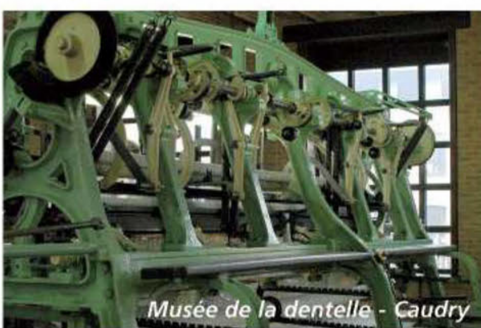
Musée de la dentelle - Caudry