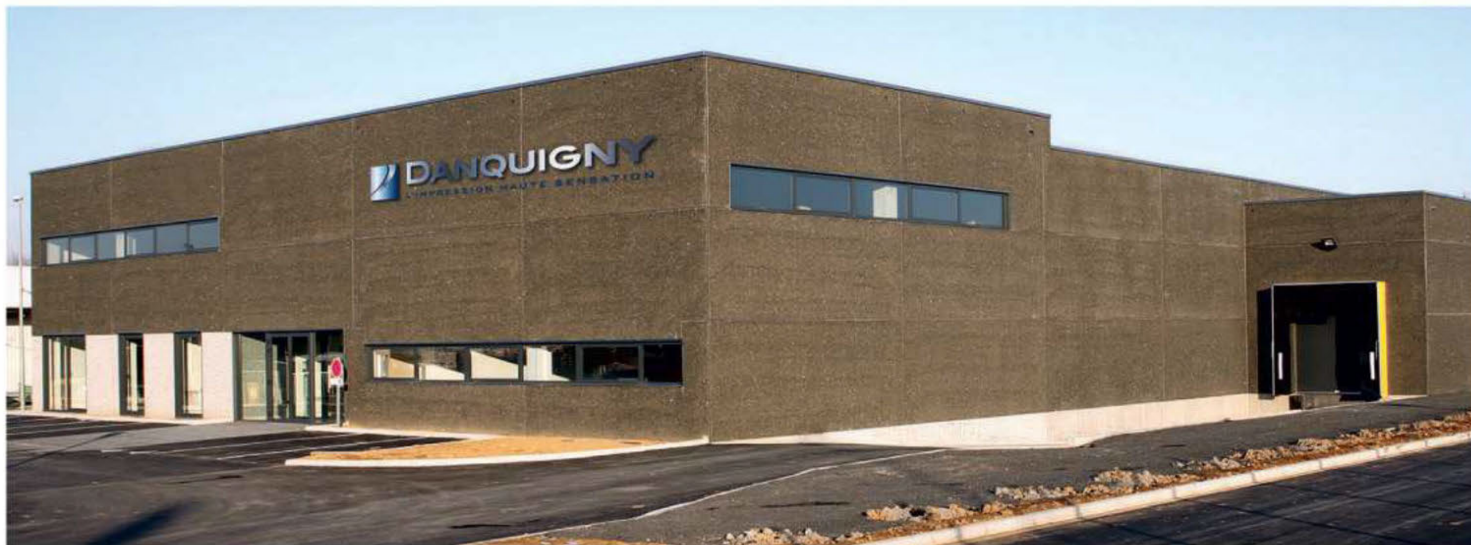
Les nouveaux bâtiments de l'imprimerie sur la Zone commerciale de Cambrai Sud.

Forte de ses 68 ans, l'imprimerie DANQUIGNY est une entreprise solide, reconnue et en plein développement. A l'étroit dans ses locaux de la rue du 4 ème cuirassiers, elle vient d'investir 3 M€ dans de nouvelles machines et un bâtiment neuf sur la ZAC de Cambrai Sud.