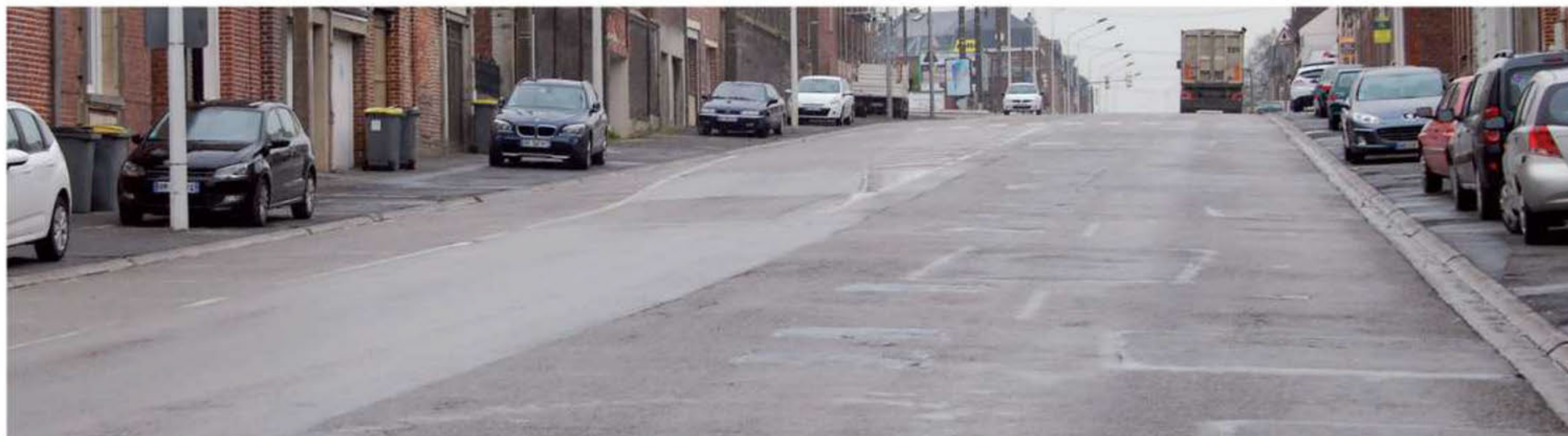
L'avenue Jules Ferry sera l'une des artères de la ville qui sera rabotée avec la pose d'un nouvel enrobé.

La rudesse de l'hiver avec des températures nettement en dessous de zéro a considérablement détérioré quelques rues importantes de Cambrai.