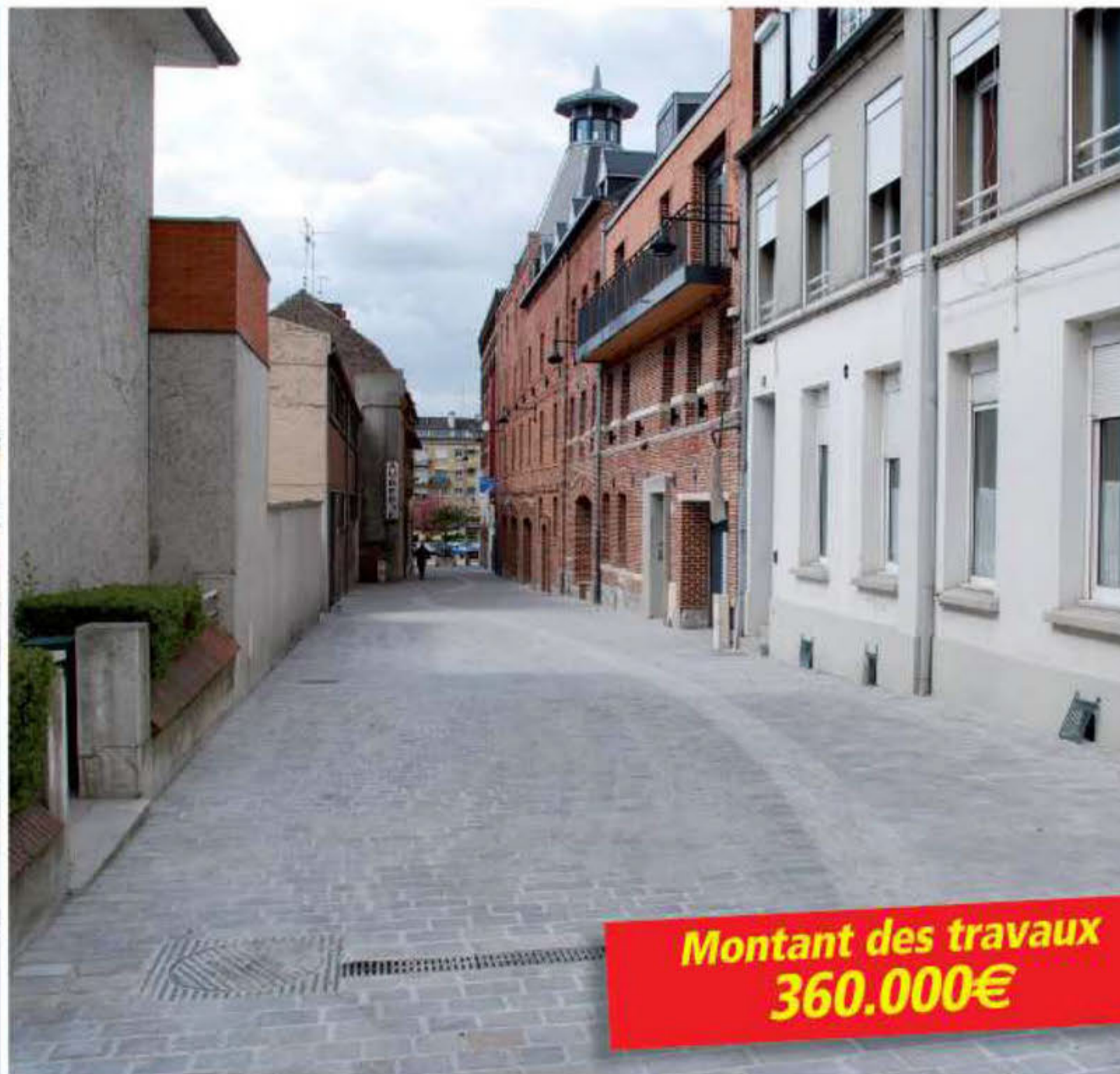
Rue de la Citadelle