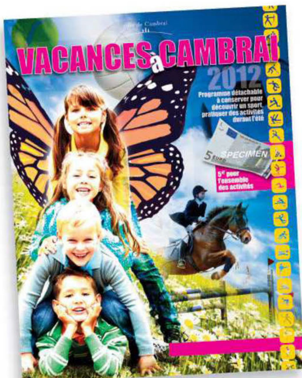
Programme des activités à détacher dans le prochain «Cambrésien».

Comme tous les ans, la Ville de Cambrai propose aux enfants de 3 à 17 ans, des centres d'accueil de loisirs organisés par le Service Enfance et Jeunesse, le SEJC. Les inscriptions pour juillet ou août ont démarré depuis le 2 mai. L'implantation des centres est répartie sur les différents quartiers de la ville au plus près de la population.