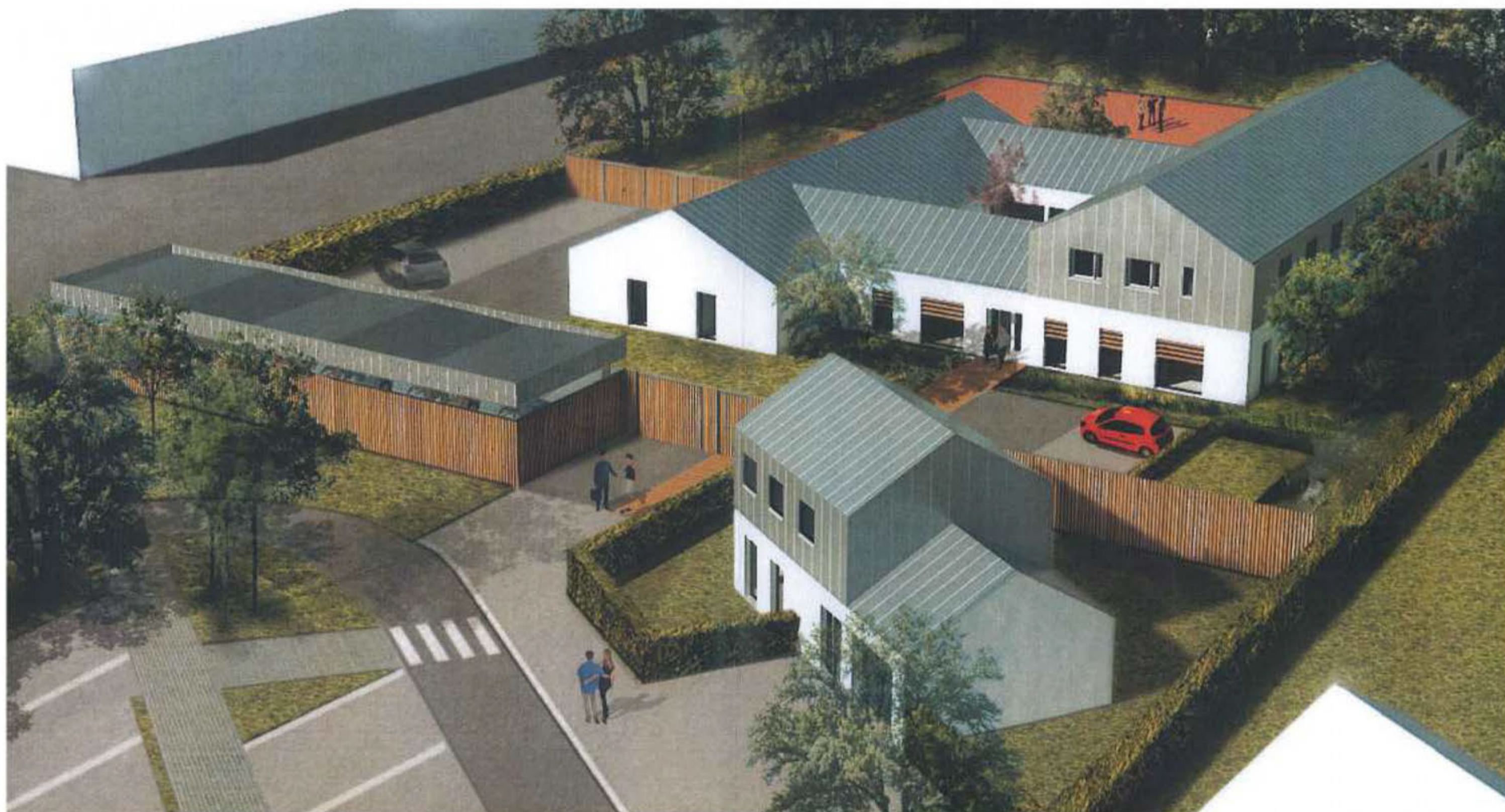
Vue 3 D du futur Centre Éducatif Fermé, rue Léonce Pallécot à Saint-Roch.

La nouvelle structure de la Protection Judiciaire de la Jeunesse s'implante dans le quartier Saint-Roch et accueillera d'ici un an environ, douze jeunes de 15 à 18 ans, sous une étroite surveillance selon le Ministère de la Justice en charge des CEF, Centres Éducatifs Fermés.