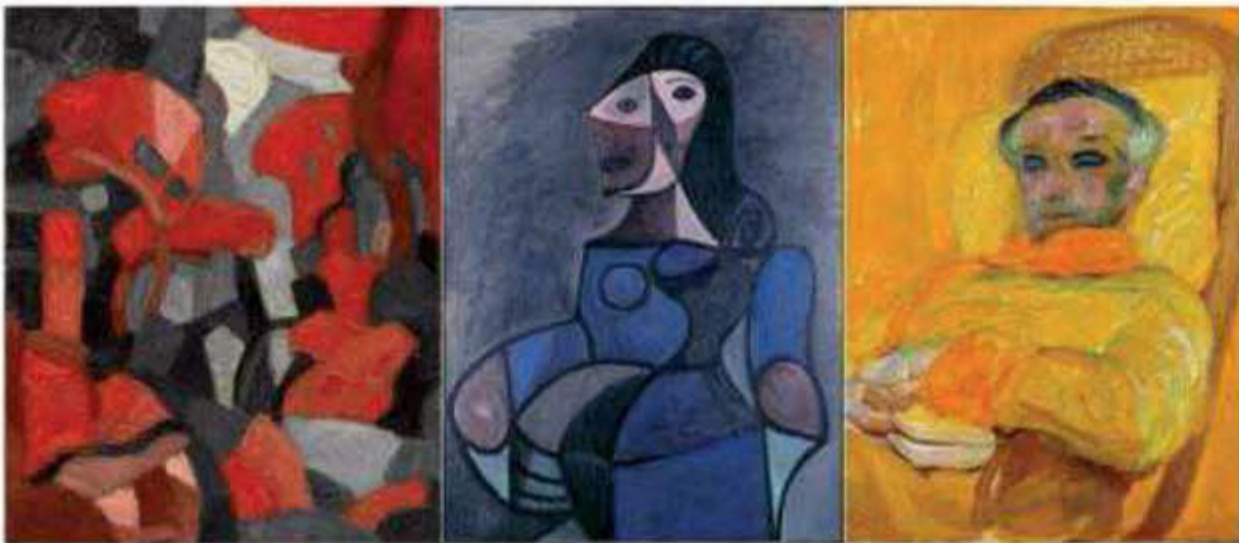
Francis Picabia, "L'Arbre rouge (Grimaldi après la pluie)", vers 1912 ; Pablo Picasso, "Femme en bleu", 1944 ; Frantisek Kupka, "La Gamme jaune" (détail), 1907. © Adagp/Succession Pablo Picasso, 2011/Adagp, 2011 / Montage Le Point.fr

Après une inauguration en grande pompe à Chaumont, le Centre Pompidou mobile entame sa deuxième escale à Cambrai.